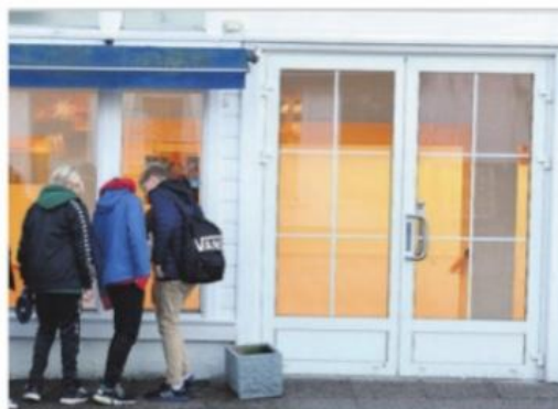
NYSGJERRIGE: Barn ser inn det tomme lokalet i Vestregate. Snart vil det være fylt med aktivitet.